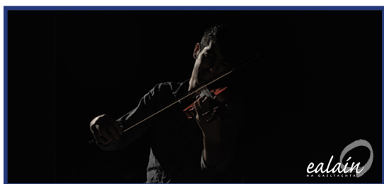
*Ealain Logo White